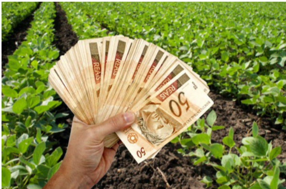
O valor do patrimônio líquido dos Fundos de Investimento nas Cadeias Produtivas do Agronegócio cresceu 147% nos últimos 12 meses

Por fim, o Certificado de Recebíveis do Agronegócio (CRA) e o Certificado de Direitos Creditórios do Agronegócio (CDCA) cresceram 26% e 8%, respectivamente, de junho de 2023 a junho de 2024. Ao final desse período, os estoques de CRA e CDCA atingiram o valor de R$ 140 e R$ 32 bilhões de reais, respectivamente.