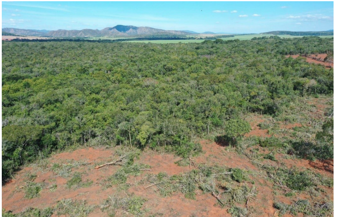
Nenhum município goiano consta entre os cinco com maior área desmatada em 2024

Em setembro de 2023, o governador assinou, com representantes do setor produtivo, um pacto em que todos assu-