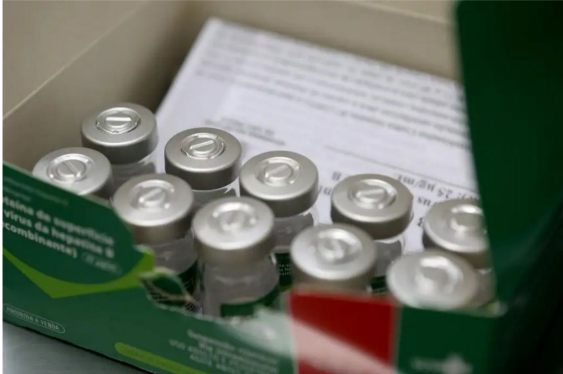
SUS oferece algumas vacinas, diagnóstico e tratamento gratuito

Neste domingo, 28 de julho, foi celebrado o Dia Mundial de Luta contra as Hepatites Virais, data em que é importante chamar atenção da população para ações de prevenção para essas inflamações que atacam o fígado, órgão com papel principal na desintoxicação do organismo