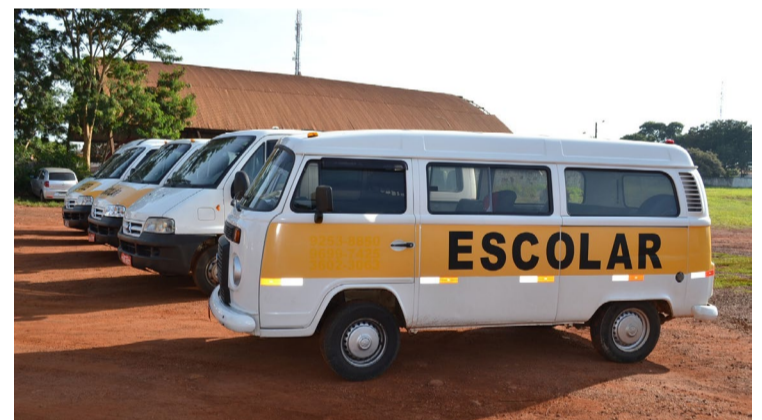
O prazo para encaminhamento de propostas para transporte escolar encerra nesta segunda, 29

Após a verificação das propostas, serão solicitados os documentos dos veículos e dos motoristas. O início da prestação dos serviços está previsto para o mês de agosto de 2024, junto com o retorno das aulas.