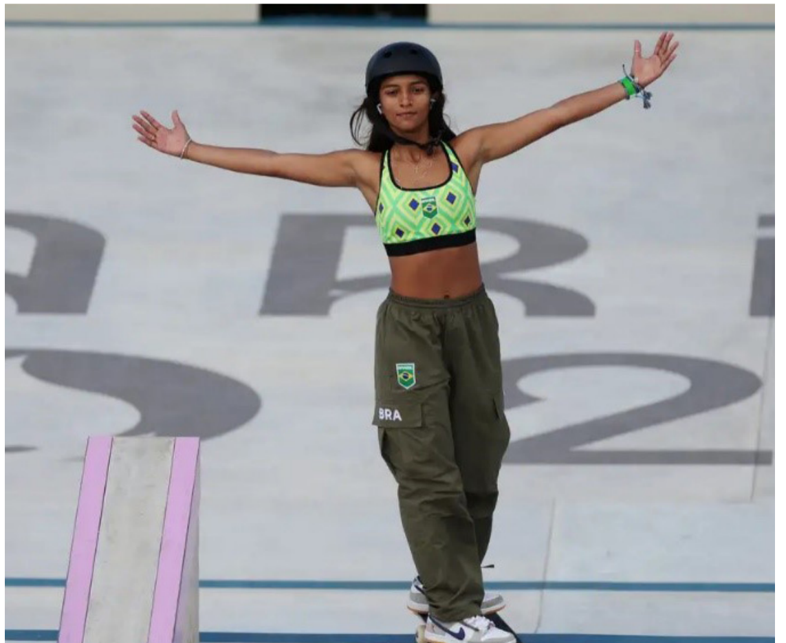
Rayssa Leal conquistou a sua segunda medalha em Olimpíadas

Na final, a brasileira terminou a fase de voltas em quinto lugar, com 71.66. No momento das manobras, o talento falou mais alto. Ela bateu o próprio recorde na segunda tentativa e fez 92.88. Rayssa errou a primeira, a terceira e a quarta tentativas. Na última, conseguiu um 88.83 para garantir o bronze em Paris. Em 2020, nas Olimpíadas de Tóquio, a maranhense Rayssa conquistou a medalha de prata, aos 13 anos. (Com Agência Brasil)