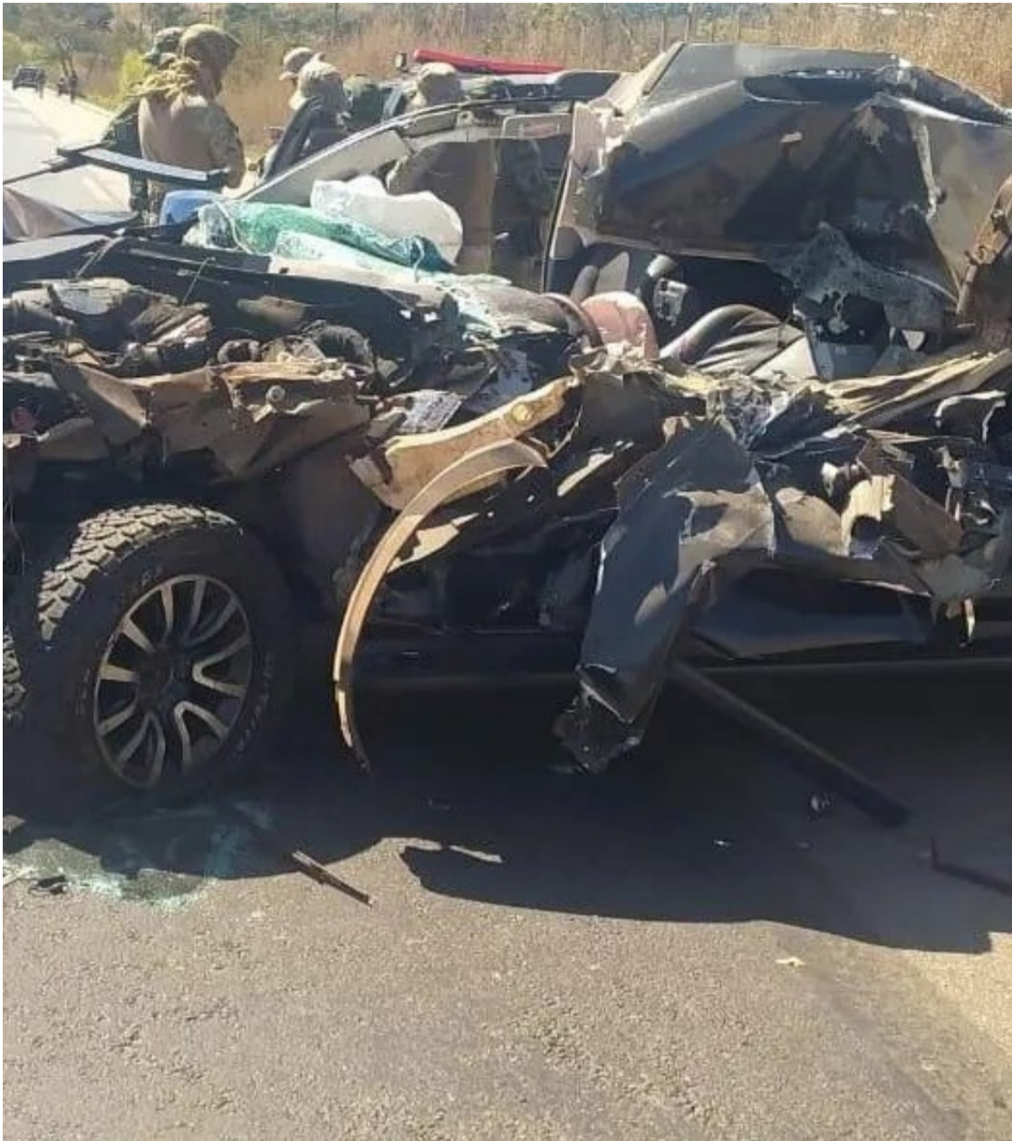
Carro do empresário ficou destruído no acidente