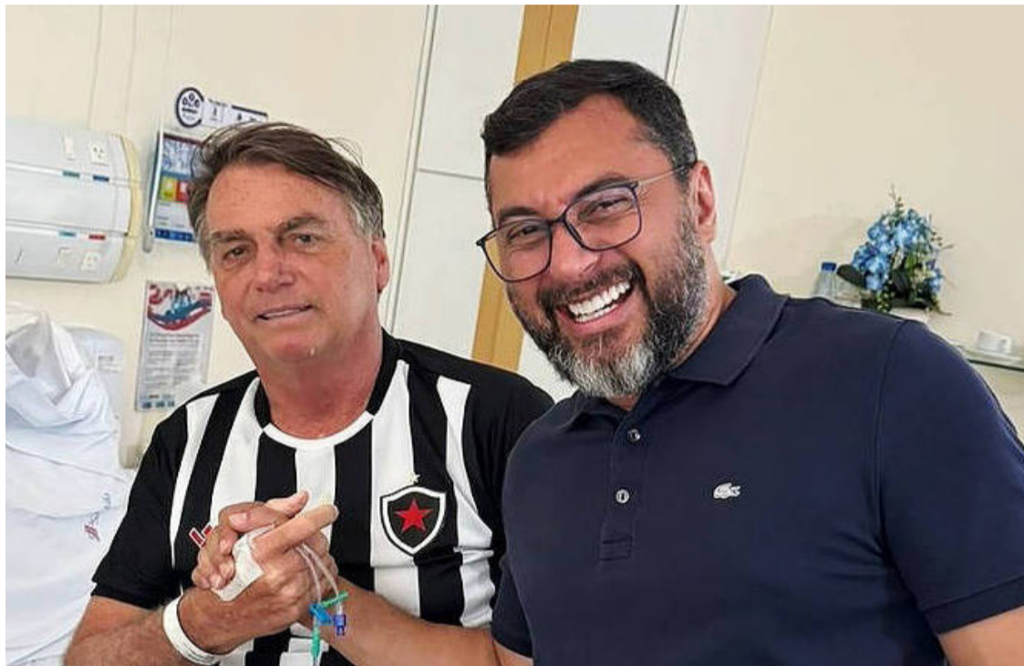
Wilson Lima e Jair Bolsonaro: eleições de 2026 distancia governador e ex-presidente

Já na corrida pela Prefeitura de Campo Grande, no Mato Grosso do Sul, com aval e participação direta do ex-presidente, o PL se aliou ao PSDB no estado e implodiu a aliança com o PP patrocinada pela senadora Tereza Cristina (PP-MS) na ca-