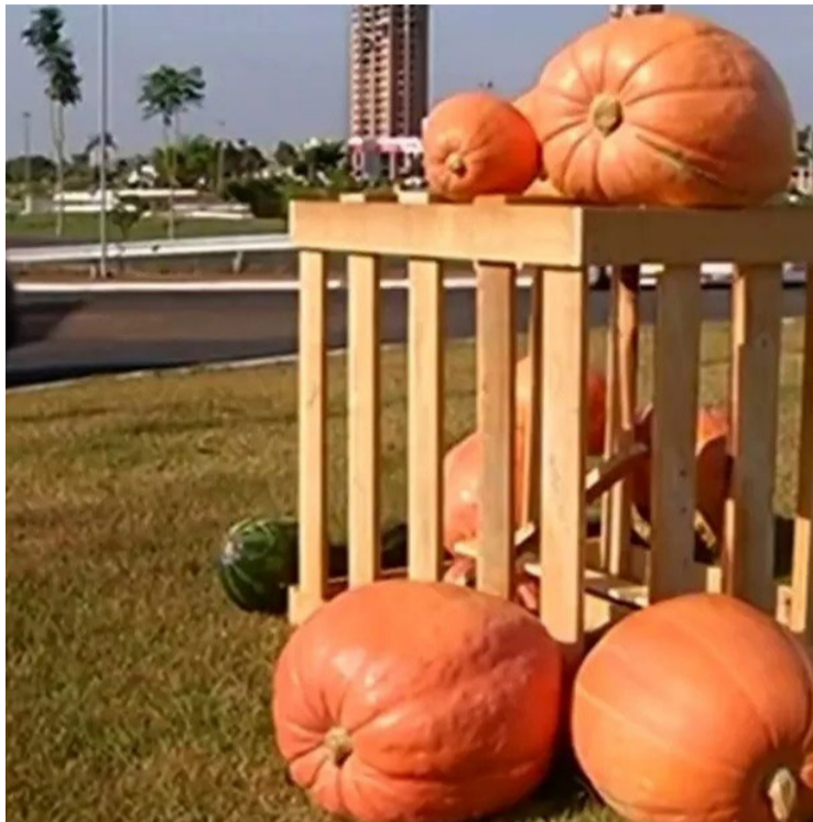
Milhares de abóboras das espécies atlantic gigante e mamute foram cuidadosamente cultivadas durante 120 dias exclusivamente para o aniversário da cidade

Para este ano, abóboras de duas espécies, atlantic gigante e mamute, foram cuidadosamente cultivadas durante 120 dias em uma área de 4 hectares. São aproximadamente 70 caminhões carregados de abóboras que foram produzidas por meio de parceria entre um produtor rural local com a prefeitura municipal e o suporte da Emater. A decoração de aniversário com as