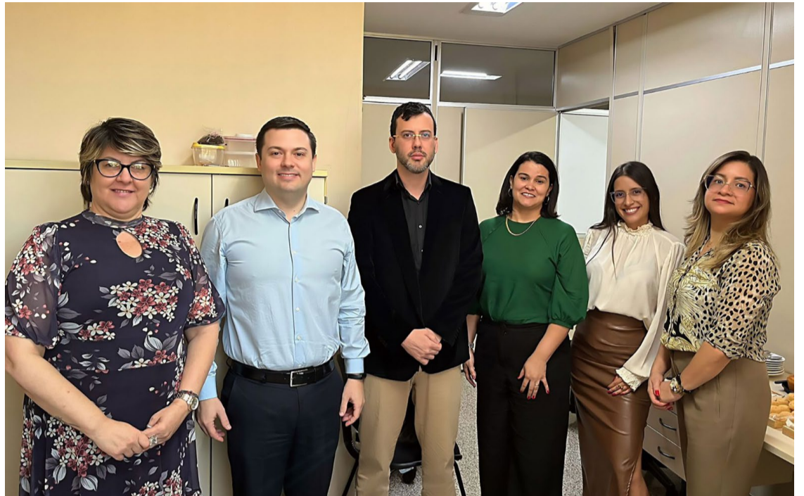
Visita da Comissão de Mulheres EmPENHAdas em Jataí

Segundo dispõe a Lei Maria da Penha, há espaço para que advogados desempenhem o papel de assistente da vítima.