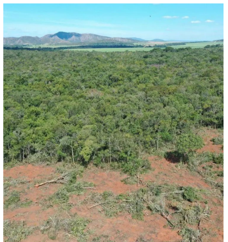
Nenhum município goiano consta entre os cinco com maior área desmatada em 2024

Vulcanis afirma que, no primeiro semestre de 2024, Goiás pela primeira vez conseguiu receptionar, revisar e atribuir responsabilização administrativa (multa e embargos) a 100% dos alertas de desmatamento recebidos, o que outros estados não conseguem fazer.