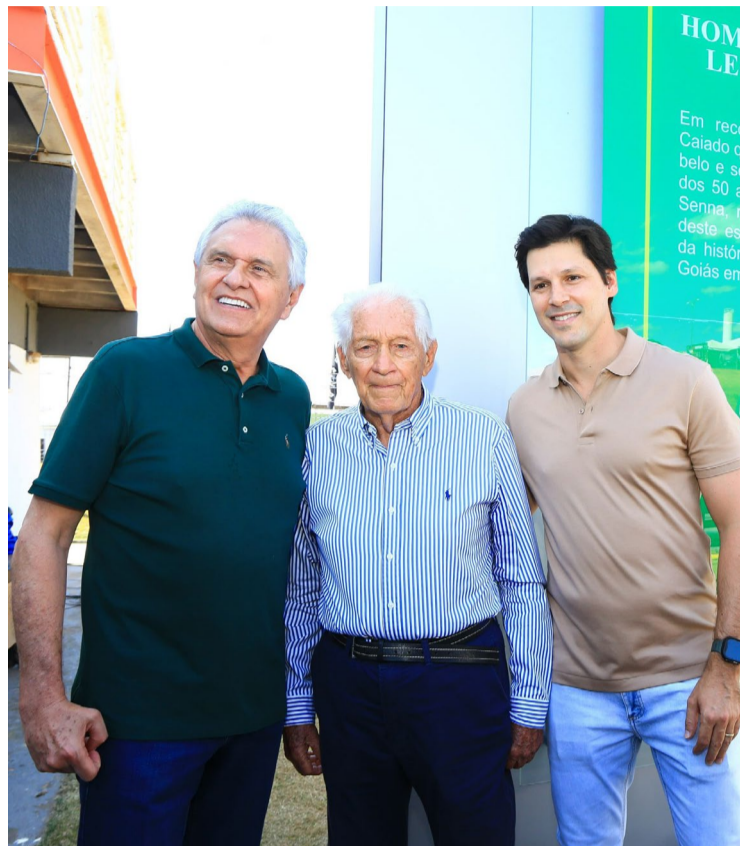
Caiado durante a comemoração dos 50 anos do Autódromo Internacional de Goiânia