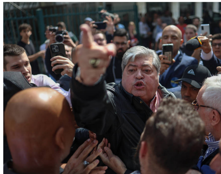
José Luiz Datena critica tucanos que defendem o prefeito Ricardo Nunes

Em diversos momentos, o apresentador insinuou, ressaltando que ainda cabe investigação, haver ligação entre os tucanos opositores e Nunes e também ao crime organizado. “Isso é misturado a bandidos que estão querendo manter o crime organizado no poder. [...] Nem sei se tem gente do PCC misturada aqui, fazendo baderna.”